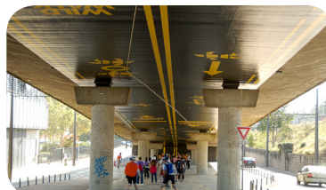
▶▶▶ Randonnée Lyon Insolites