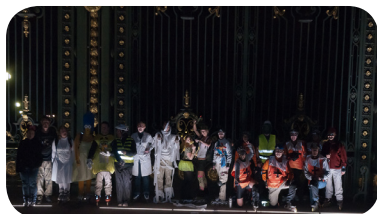
▶▶▶ Rando «M»